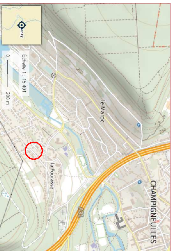
Plan de situation sans échelle