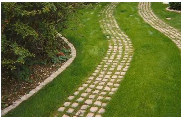
Pavés + Gazon