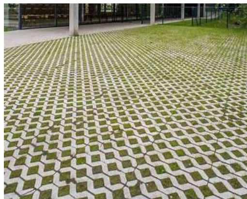
Pavés + Gazon